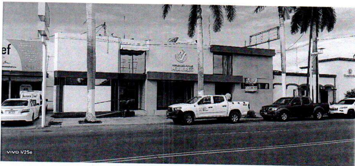
Edificio de la Secretaría de las Mujeres, ubicado en la Avenida Miguel Alemán, en la Localidad de Ciudad Obregón, Municipio de Cajeme.

El día 05 de diciembre de 2025, me trasladé al municipio de Cajeme, Sonora y me presenté en las oficinas del Secretaría de las Mujeres, donde se entregó el oficio No. DS-1072/205 y se recabaron los acusases correspondientes: